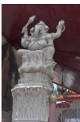
ภาพที่ 7 รูปปูนปั้นพระพิฆเนศ หน้าพระวิหารวัดมหาธาตุวรวิหาร จ.เพชรบุรี

จากการประเมินผล ตามกรอบการปฏิบัติการ ม.ค.อ 3 รายวิชาประติมากรรม เมืองเพชรบุรี รหัสวิชา 207326 : 2(1-2-3) มหาวิทยาลัยราชภัฏเพชรบุรี สรุปผล การจัดการ ความรู้กิจกรรมการสืบสานภูมิปัญญาปูนปั้นและเทคนิคแนวความคิดนายทองรุ่ง เอ็มโษษฐ ศิลปินแห่งชาติสาขาทัศนศิลป์(ประณีตศิลป์-ศิลปะปูนปั้น)จังหวัดเพชรบุรี ดังนี้