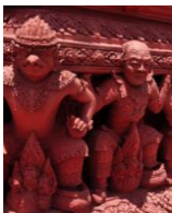
ภาพที่ 6 ซุ้มทำวพระพรหมม สถานีรณรางไฟฟ้าเคเบิลคาร์ (เขาวัง) จ.เพชรบุรี