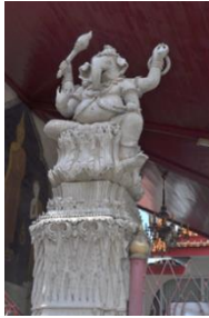
ภาพที่ 8 รูปตัวอย่างปูนปั้นพระพิฆเนศ หน้าพระวิหารวัดมหาธาตุวรวิหาร จ.เพชรบุรี