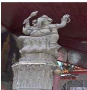
ภาพที่ 2 รูปปั้นพระพิฆเนศ หน้าพระวิหารวัดมหาธาตุวรวิหาร จ.เพชรบุรี

พ.ศ. 2534 ปั้นนางในวรรณคดีหน้าอาคารตึกอรุณพงษ์ วิทยาลัย อาชีวศึกษาเพชรบุรี จ.เพชรบุรี