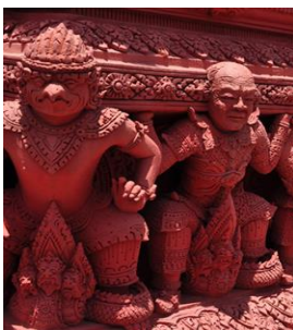
ภาพที่ 4 ซุ้มท้าวพระพรหม สถานีรรางไฟฟ้าเคเบิลคาร์ (เขาวัง) จ.เพชรบุรี

พ.ศ. 2544 ปั้นภาพประเพณีไทย สะพานท่าสงฆ์ จ.เพชรบุรี