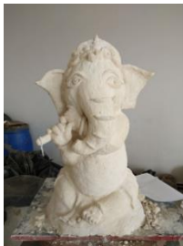
ภาพที่ 10 ตัวอย่างที่ 2 ผลงานปูนปั้นนักศึกษารายวิชาประติมากรรมเมืองเพชรบุรี: 2(1-2-3) รหัสวิชา 207326มหาวิทยาลัยราชภัฏเพชรบุรี