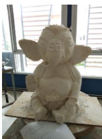
ภาพที่ 12 ตัวอย่างที่ 2 ผลงานปูนปั้นนักรักรายวิชาประติมากรรมเมืองเพชรบุรี : 2(1-2-3) รหัสวิชา 207326มหาวิทยาลัยราชภัฏเพชรบุรี

สรุปผลกิจกรรมการจัดการความรู้สืบสานภูมิปัญญาปูนปั้นและเทคนิคแนวความคิดนายทองรุ่ง เอ็มโอษฐ์ ศิลปินแห่งชาติสาขาศิลปะ (ประณีตศิลป์-ศิลปะปูนปั้น)จังหวัดเพชรบุรี