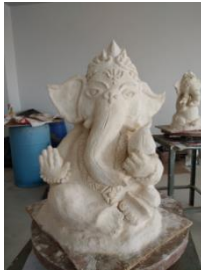
ภาพที่ 9 ตัวอย่างที่ 1 ผลงานปูนปั้นนักศึกษารายวิชาประติมากรรมเมืองเพชรบุรี : 2(1-2-3) รหัสวิชา 207326มหาวิทยาลัยราชภัฏเพชรบุรี