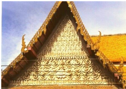
ภาพที่ 1 หน้าบันโรงเรียนพระปริยัติธรรมวัดพลับพลาชัย จังหวัดเพชรบุรี

การปั้นปูนผลงานปูนปั้นระยะแรกนั้นประเภทสวยงาม ได้เลียนแบบจากงานเก่าและขอคำปรึกษาจากครุพิน อินฟ้าแสง ผลงานส่วนใหญ่ใช้ลายไทยพื้นฐานเป็นตัวอย่างเช่น ลายกระจัง ลายยักษ์แบก ลายลิงแบก เป็นลายพื้นฐานปฏิบัติฝึกฝนจนเชี่ยวชาญนำไปสู่ความเป็นช่างปูนปั้นออกรับงานปูนปั้นด้วยตัวเอง