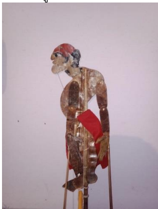
ภาพที่ 1 ไอ้เกลี้ยง

จากความสำคัญของการบอกเรื่องดังที่ได้กล่าวมา นักวิชาการส่วนใหญ่ไม่ค่อยให้ความสำคัญที่จะศึกษาการบอกเรื่องทั้งหนังตะลุงภาคใต้และหนังตะลุงเมืองเพชรอย่างจริงจัง มีเพียงกล่าวถึงไว้ว่าเป็นส่วนหนึ่งของขนบการแสดงหรือให้รายละเอียดเนื้อหาว่า ประกอบด้วยอะไรบ้าง แต่ไม่ได้มีการวิเคราะห์ลำดับเนื้อหาและลักษณะเนื้อหาที่เป็นหัวใจของการบอกเรื่อง และไม่มีการตีความถึงนัยยะแฝง รวมทั้งบทสะท้อนทางสังคมและวัฒนธรรมของบริษัทท้องถิ่นเลย ดังนั้น ผู้วิจัยจึงสนใจที่จะศึกษาการบอกเรื่องของหนังตะลุงเมืองเพชรในประเด็นดังกล่าว