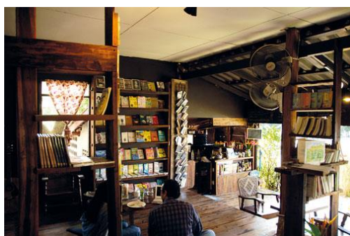
ภาพที่ 8 บรรยากาศร้านหนังสือเชียงดาว

แม้จะมีเสียงคัดค้านว่าการเปิดร้านหนังสือในยุคดิจิทัลอาจอยู่รอดได้ยาก แต่คุณเองก็ยังยืนยันในสิ่งที่ทำด้วยความเชื่อว่าร้านหนังสือสามารถสร้าง “สังคมการอ่านที่มีชีวิต” ซึ่งหนังสือดิจิทัลไม่สามารถสร้างได้ โดยแบ่งพื้นที่ใต้ถุนร้านเป็น “ห้องสมุดชุมชน” อนุญาตให้ยืมหนังสือกลับบ้านก็วันก็ได้ และนำมาคืนเมื่ออ่านจบ เป็นการส่งเสริมการอ่านให้กับคนในท้องถิ่นและพบว่ามีนักอ่านที่นำหนังสือดีๆ มาบริจาคให้กับห้องสมุดเพิ่มขึ้นด้วย