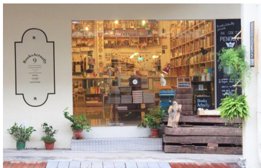
ภาพที่ 10 บรรยากาศร้าน BooksActually

BooksActually ร้านหนังสืออิสระในสิงคโปร์ บริหารงานโดยเคนนี่ เลค (Kenny Leck) ชายหนุ่ม ผู้หลงรักหนังสือเริ่มกิจการเล็กๆ ด้วยโต๊ะขายหนังสือสองตัวในมหาวิทยาลัยและขยายกิจการในย่านที่ไม่พลุกพล่านนักในสิงคโปร์ ก่อนที่จะทำธุรกิจร้านหนังสืออย่างเต็มตัวในช่วงที่ค้นพบความชอบของตัวเองในขณะที่เรียน เขาตัดสินใจลาออกจากวิทยาลัยกลางคันเพื่อไปทำในสิ่งที่เขารักนั่นคือการทำงานในร้านหนังสือ ปัจจุบันเคนนี่ ได้ย้ายไปเปิดร้านในสถานที่ใหม่