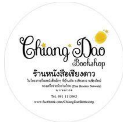
ภาพที่ 7 สัญลักษณ์ร้านหนังสือเชียงใหม่

ร้านนี้เป็นร้านหนังสือในโครงการ “ร้านหนังสือเล็กๆ ที่บ้านเกิด” ตั้งอยู่ติดกับสหกรณ์การเกษตรเชียงใหม่ อยู่ห่างจากสถานีขนส่งเชียงใหม่ไปเล็กน้อย ภายในร้านตกแต่งเรียบง่ายด้วยเฟอร์นิเจอร์ไม้ เจ้าของคือคุณองอาจ เตชะ