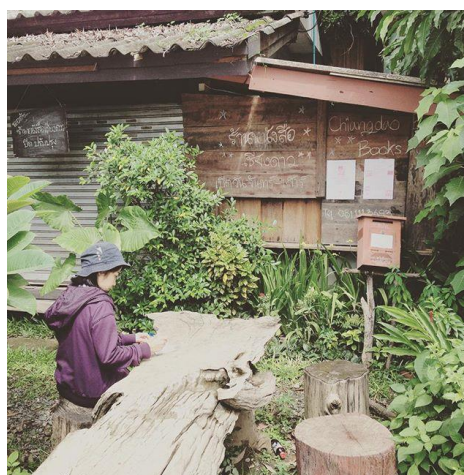
ภาพที่ 9 บรรยากาศหน้าร้านหนังสือเชียงดาว

เรื่องราวที่ดีของร้านหนังสือเชียงดาวนี้ทำให้ผู้เขียนหาโอกาสแวะไปเยี่ยมชมเยือน แต่น่าเสียดายที่ในวันที่ผู้เขียนและเพื่อนเดินทางไปเชียงดาวนั้นเป็นช่วงที่ร้านหนังสือปิดปรับปรุงระหว่างที่เดินทางร้านนั้นมีความลังเลใจที่จะถามหา กับผู้คนเพราะคิดว่าใครจะรู้จักร้านหนังสือถ้าไม่ใช่ นักอ่าน แต่แล้วที่สุดก็ตัดสินใจถามจากคนบริเวณนั้น ซึ่งก็ได้รับคำตอบที่ชัดเจนสัมผัสได้ถึง ความคุ้นเคยระหว่างคนพื้นที่กับร้านหนังสือ ครั้งนั้นทำได้เพียงแวะนั่งเขียนโปสการ์ดที่หน้าร้าน ครั้งต่อไปตั้งใจไว้ว่าจะเข้าไปอ่านหนังสือสักเล่ม